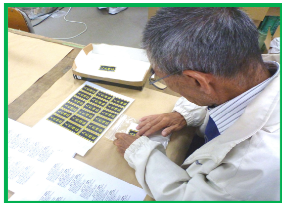
* 下請け作業（商品のシール貼り）