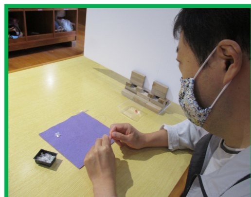
* ビーズ作業（アクセサリ作り等）

○就労継続支援B型事業では、就労能力向上を図るため、挨拶練習や学習会、地域清掃散歩などの活動も行っています。