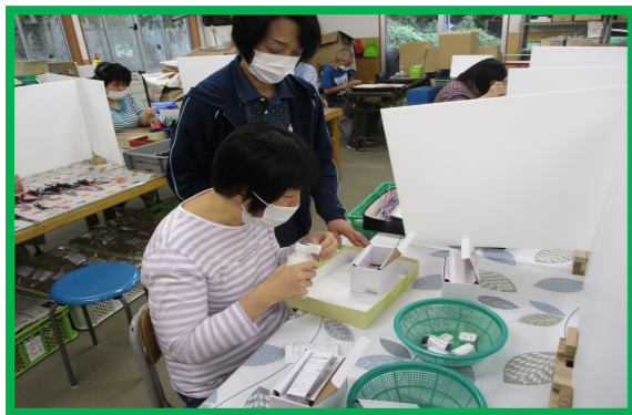
* 下請け作業（検品作業）

生産（作業訓練、作業目標、作業工程など）、販売、工賃支給を通して社会参加を図るとともに、作業の楽しさや完成の喜びを得るよう支援をします。作業科目は、下請け作業（製品の検品、ミラーマット消毒、自動車電子部品の組み立てなど）やビーズ・木工・手芸などです。