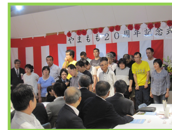
やまもも20周年記念