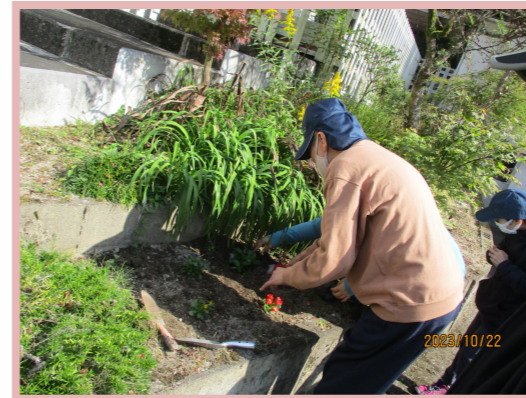
* アクティビティ活動（園芸）