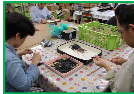
* 下請け作業（自動車電子部品組み立て）