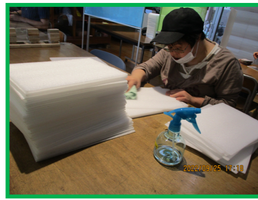
* 下請け作業（ミラーマットの消毒）