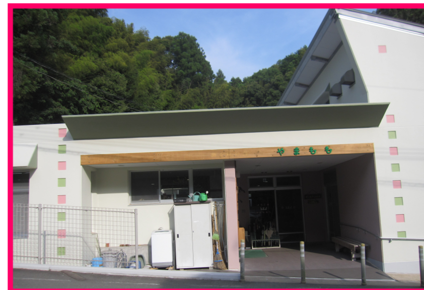
やまもも(正面玄関より)